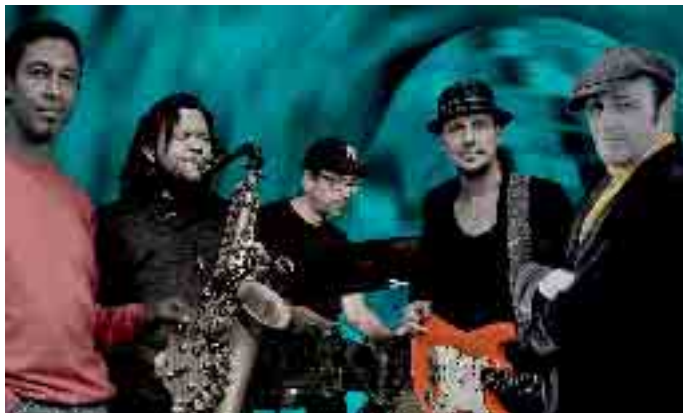
The Soulfisticated People