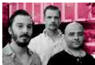
New Simplicity Trio